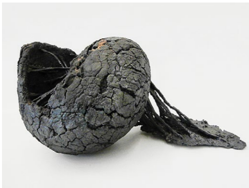
Intertwined 2018, glazirana keramika, 47 x 26 x 23 cm