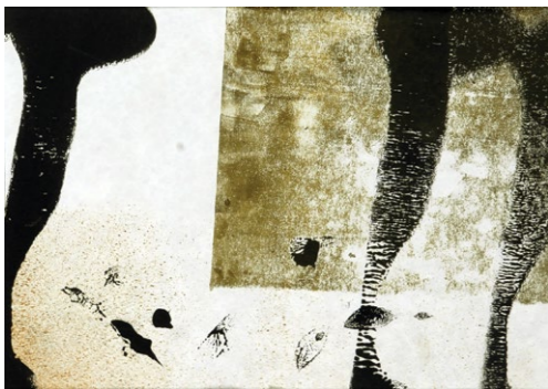
Iz serije Mikrokozmos 2010, mešana tehnika, 12 x 22 cm

Nenehno eksperimentiranje med študijem jo je pripeljalo do tehnično in likovno zanimivih rešitev v oblikovanju školjk. Med bivanjem v Vroclavu je eksperiment postal oblikovalski princip, ki determinira formo. Prav forma je v keramiki, ki se rada igra s fascinantnimi površinskimi glazurnimi efekti, največji problem. Vsi predvidljivi in izzvano naključni elementi so nosilci zavednih oziroma hotenih, kot tudi povsem nezavednih sporočil. V svojem ustvarjanju združuje glino z lasmi, vlakni, bombažem, tekstilom, povoji ali drugimi rabljenimi materiali, ki jih predela in reciklira v svojih skulpturah. Zunanja oblika, s katero manipulira, je v bistvu trdna oblika, ki izvira iz školjk, ki lahko desetletja ostanejo nedotaknjena, pa vendar jih zunanji vplivi in okolje počasi rušita, razkrajata in uničujeta. To je pojav, ki ga lahko prenesemo tudi na naše življenje, ki ga skozi čas spreminjajo različni dejavniki.