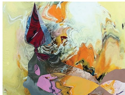
Točno opoldne 2017, generative art, 50 x 70 cm

Dilema ali računalnik lahko tudi ustvarja, mu je bil izziv v vseh obdobjih delovanja na področju informacijskih sistemov in računalniških tehnologij. Poznavanje računalniškega programiranja in poglobljanje v bistvo delovanja računalnika mu je omogočilo razvoj edinstvenega projekta, s katerim poskuša uveljavljati specifično smer računalniške umetnosti. Njegove stvaritve so računalniški programi, ki po zagonu avtonomno ustvarjajo slike, vedno nove in neponovljive. Metoda je poznana pod imenom »generative art« in se v svetu uveljavlja kot pristop do umetnega ustvarjanja in potrjuje tezo o veliki povezanosti med znanostjo in umetnostjo.