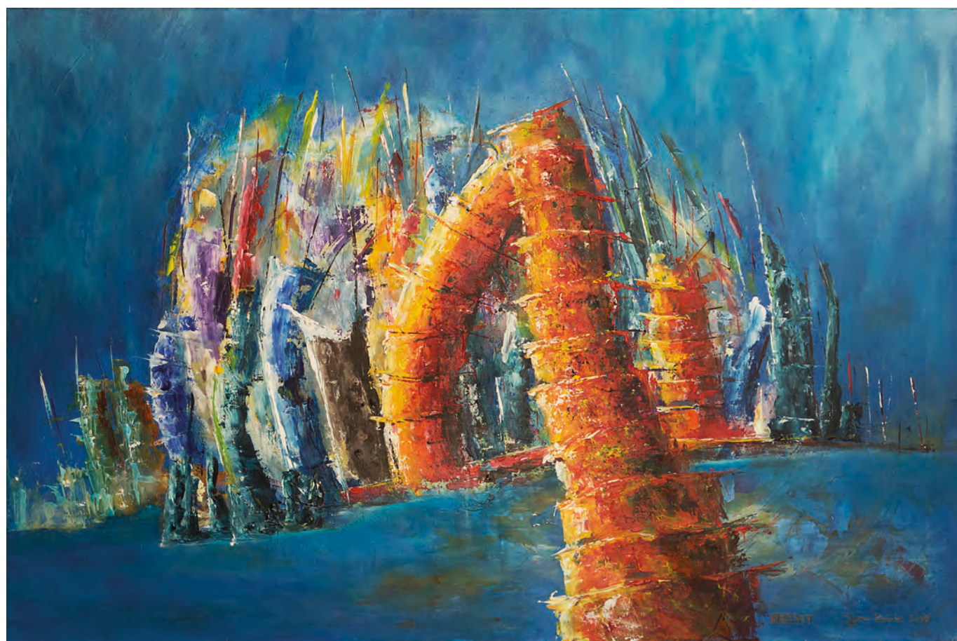
BREXIT, 2019, akril-platno, 80 cm x 120 cm

stopov naredi v obravnavani temi vidno tudi tisto, kar je nevidno. Posamezna tematska izhodišča ga popolnoma okupirajo in tako se vrstijo dela v ciklih. Z eno samo sliko ne more vsega izpovedati, zato nastajajo nove in nove. Ko čuti, da je povedal vse, da je našel racionalno in emocionalno razlago, da je na likovni način v polnosti osvetlil pomen, da je iz sebe dal in iz svojega medija izčrpal vse, kar ga teži, začne z novo temo. Ob zaključku se počuti lahkotno, veselo, samouresničeno. Doživi neke vrste katarzo. V svojem delovanju uresničuje načelo Norberta Lyntona, ki pravi, da je umetnik tudi učitelj, njegovo delo pa apel. Pogled nazaj kaže, da je Igor v svojem življenju in ustvarjanju naredil pomembne premike, da je