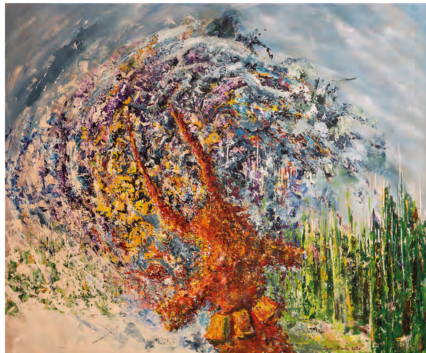
KURENT ODGANJA ZIMO, 2020, akril-platno, 100 cm 120 cm

Slike Igorja Zimica postajajo vse bolj notranje dinamične, polne soočanj nasprotij, a vendarle vseh skozi skrbno grajene in popeljane v stanje ravnotežja. Dinamiko jim dajejo barvni odnosi, soočanja med ostrimi in mehкими oblikami, med strukturalnimi poudarki in gladkimi deli, med linijami in ploskvami, med elementi izpovednosti in spremljajočim ozadjem. Kompozicije so premišljene in osmišljene. Zdi se, da jih določa bipolarnost tako v likovnem kot v vsebinskem smislu. Naspro-