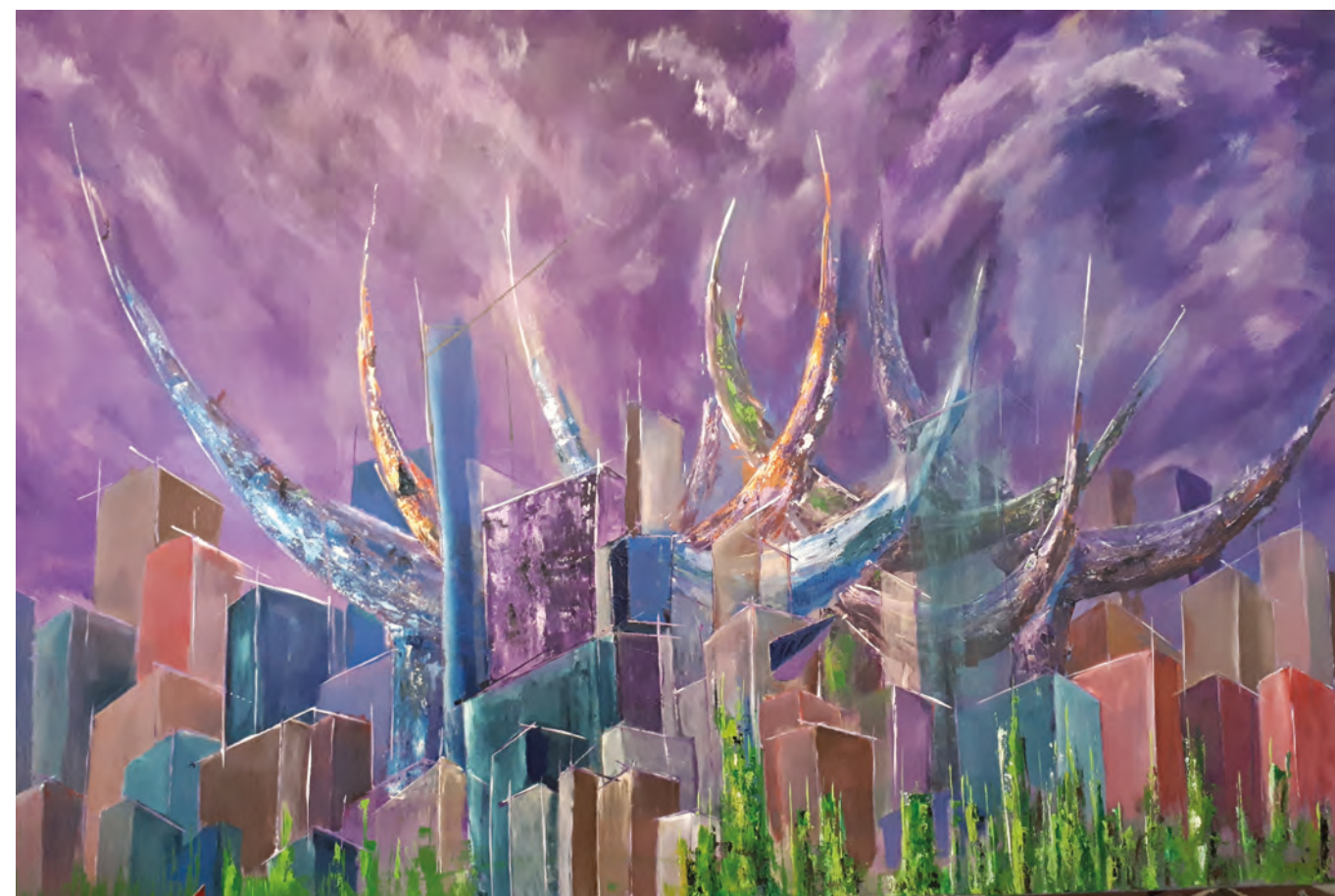
LOKALNE VOLITVE, 2017, akril-platno, 100 cm x 150 cm

znal z likovnimi besedami odgovoriti na marsikatero dogajanje in stanje. Preizkušnje in spremembe je prevedel v likovne podobe. Na vprašanja je vedno našel likovni odgovor. Ta je zanj edini pravi in pomirjujoč. Prelomnice so botrovale novim likovnim ciklom. Likovna izrazna sredstva pa so tista, ki mu omogočajo uresničevanje percepcije časa in prostora ter osebnih duhovnih in duševnih stanj. Omogočajo mu najti najbolj verodostojen odgovorov. V eni izmed serij se je slikar poklonil briškim vasicam. Ujel je temeljne poteze krajinskega obraza, arhitekturo, vraščeno v slikovito okolje, svetlobo v toplih tonih. Predstavil je resničnost, v katero iz linijsko razparceliranega in geometrijsko učinkujo-