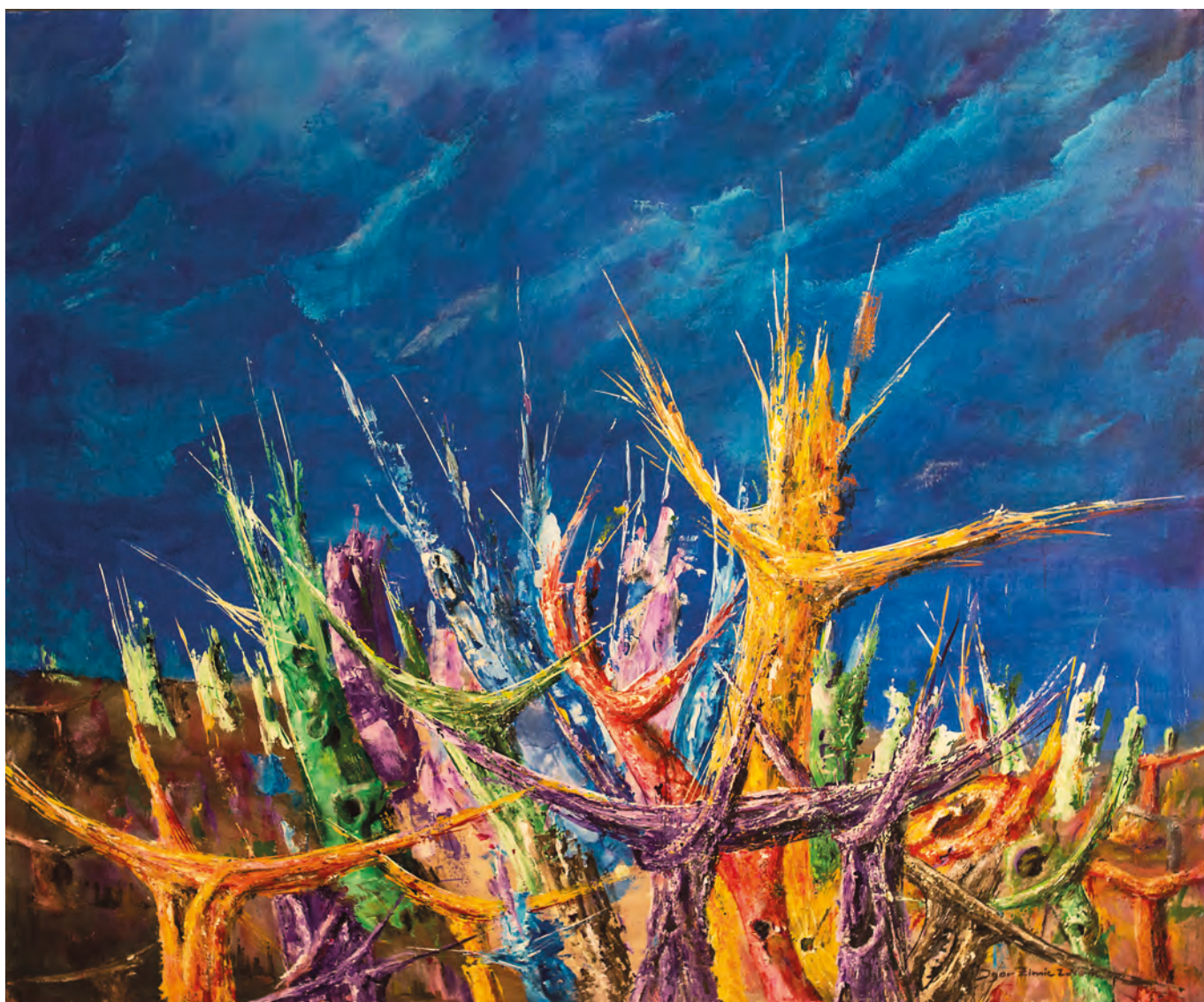
KAOS, 2018, akril-platno, 126 cm x 152cm

Likovno ustvarjanje Igorja Zimica se je začelo kot dialog z vizualno stvarnostjo, ki je bila zanj zavezujoč optični normativ. Doseči njeno adekvatnost na slikovnem polju pa tisti cilj, ki se mu je skrbno in z ljubeznijo posvečal. Potovanja po likovnem svetu je bilo vseskozi povezano tudi z lastnim raziskovanjem in študijskim poglobljanjem ter tako z vsebinskim kot likovnim razmišljanjem. Postopoma ni bil več ustvarjalno izpolnjen, če mu je uspelo doseči le istovetnost med videnim in naslikanim, če mu je uspelo uresničiti perspektivična načela, doseči oblikovno dovrše-