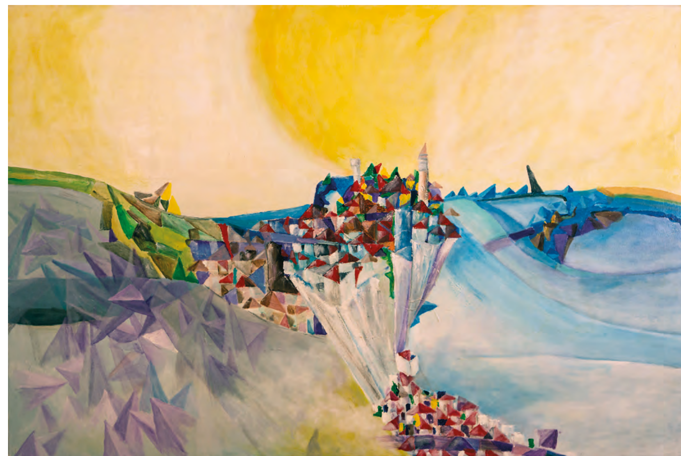
PIIRAN 1., 2014, akril-platno, 100 cm x 150 cm

Njegova slikarska platna namreč živijo v prevladujoči modri, nato rdeči, pa tudi v vijioletnih tonih. Začel je uporabljati zeleno, ki jo v preteklih slikarskih serijah ni zaznal. Najnovejše obdobje pa ima ob intenzivnih vrednostih protipol v pastelnih barvah. Čiste, intenzivne barve, nanešene v obliki bogatih barvnih impastov, sestavljene v pogosto dramatično napete, celo drzne konfrontacije, se srečujejo s tistimi, ki kažejo na mehka prehajanja,