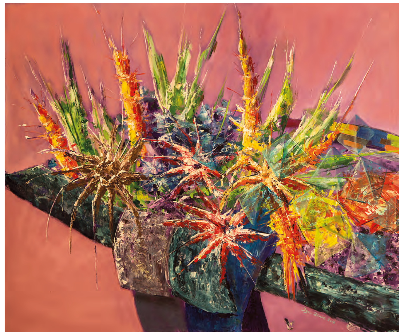
ŠOPEK, 2018, akril-platno, 100 cm x 150 cm

nost, volumetričnost, se občutljivo približati barvnim danostim in seveda izgraditi prava kompozicijska izhodišča. S sliko je želel povedati več, vendar ne na neposredno prepoznaven način. Podobno je želel podpreti s svojo občutljivo percepcijo, s pronicljivo analizo vsebine, z asociativnimi namigi in metaforami. Zamikale so ga simbolne dimenzije, preoblikovana in globlje sporočilna pomenkost. Pripoved je želel spremeniti v izpoved, realno stanje v osebno duhovno videnje. Intenzivnost doživljanja in odzivanja je prelil v (s)likovni jezik. Tako je v likovno formalnem smislu stopil na