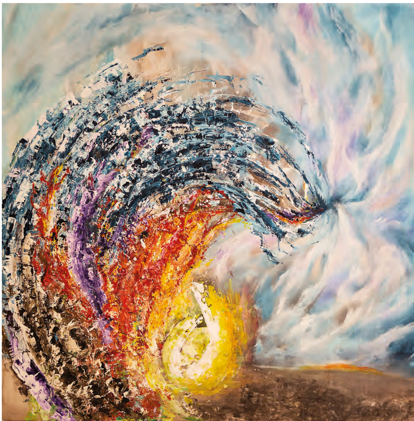
ŠTIRJE ELEMENTI, 2020, akril-platno, 119 cm x 119 cm

izrazil več sebe. In vendar, če še naprej parafraziram s Kandinskim, ne želi zapustiti tudi nje same, njenih zakonov, zato se v njegovih slikah srečujejo barve, ki objektivizirajo štiri elementarna znamenja, ki zrcalijo zemljo in nebo, odražajo materialno in duhovno. Nepogrešljiva mu je prisotnost bele, posega po črni, a obe dozira v premišljeno odmerjenih količinah. Slikarjev ustvarjalni čas bi lahko razdelili celo na posamezne nosilne barve.