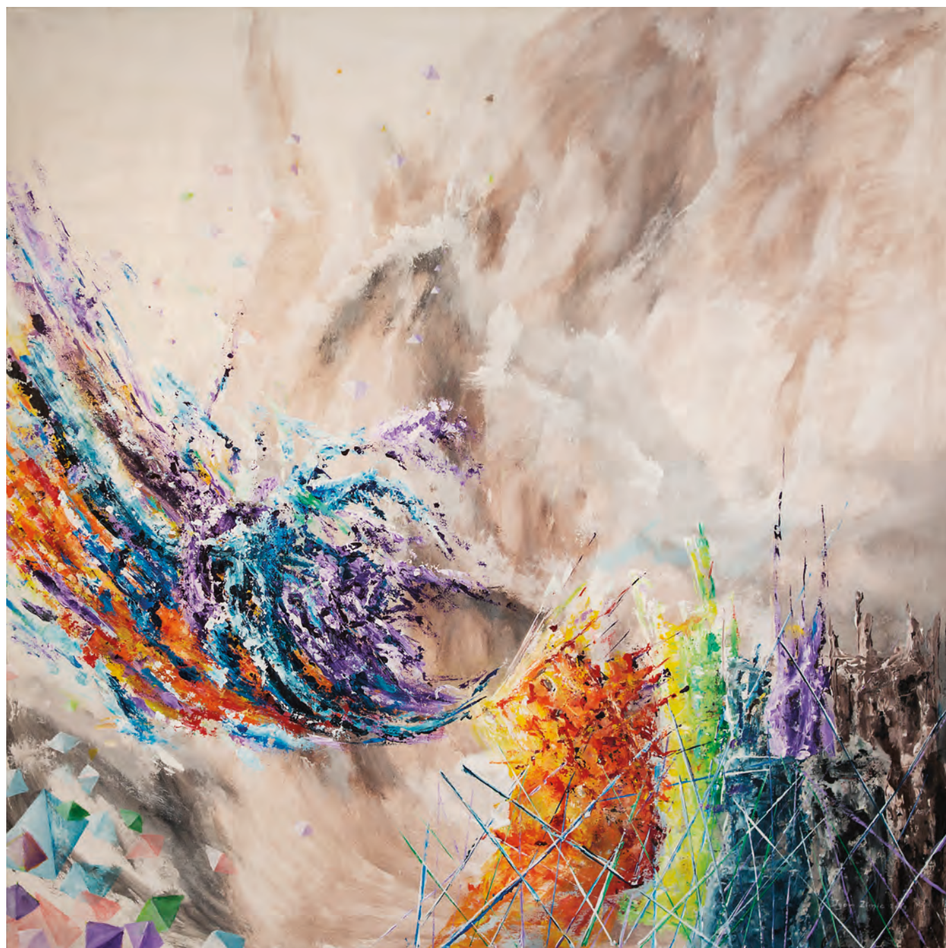
ODRINI SE, 2020, akril-platno velikost, 120 cm x 120 cm

poudarek segmentiranim, odprtim nanosom, mehkim formam ter poetičnim prelivanjem oblakov, ki pljujejo po nebu. Naredil je še eno prelomnico v svoji ustvarjalnosti, ne da bi prelomil zavezo z vsem tistim, kar določa njegovo poetiko in ji daje nezamenljivo avtorsko svojstvenost. Sedaj pa odlaga tudi službene obveznosti in nova prelomnica mu bo omogočila, da se bo še z večjo predanostjo posvetil mediju, ki ga osrečuje, kliče,