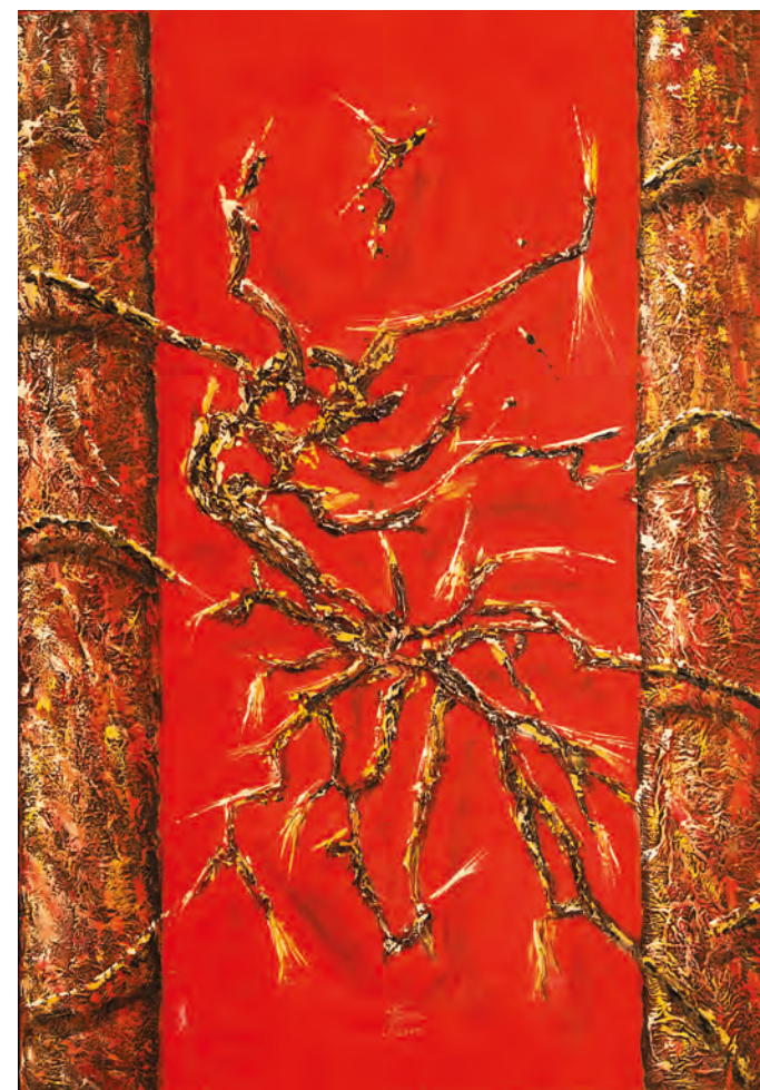
GENETIKA, 2010, 100 cm x 70 cm