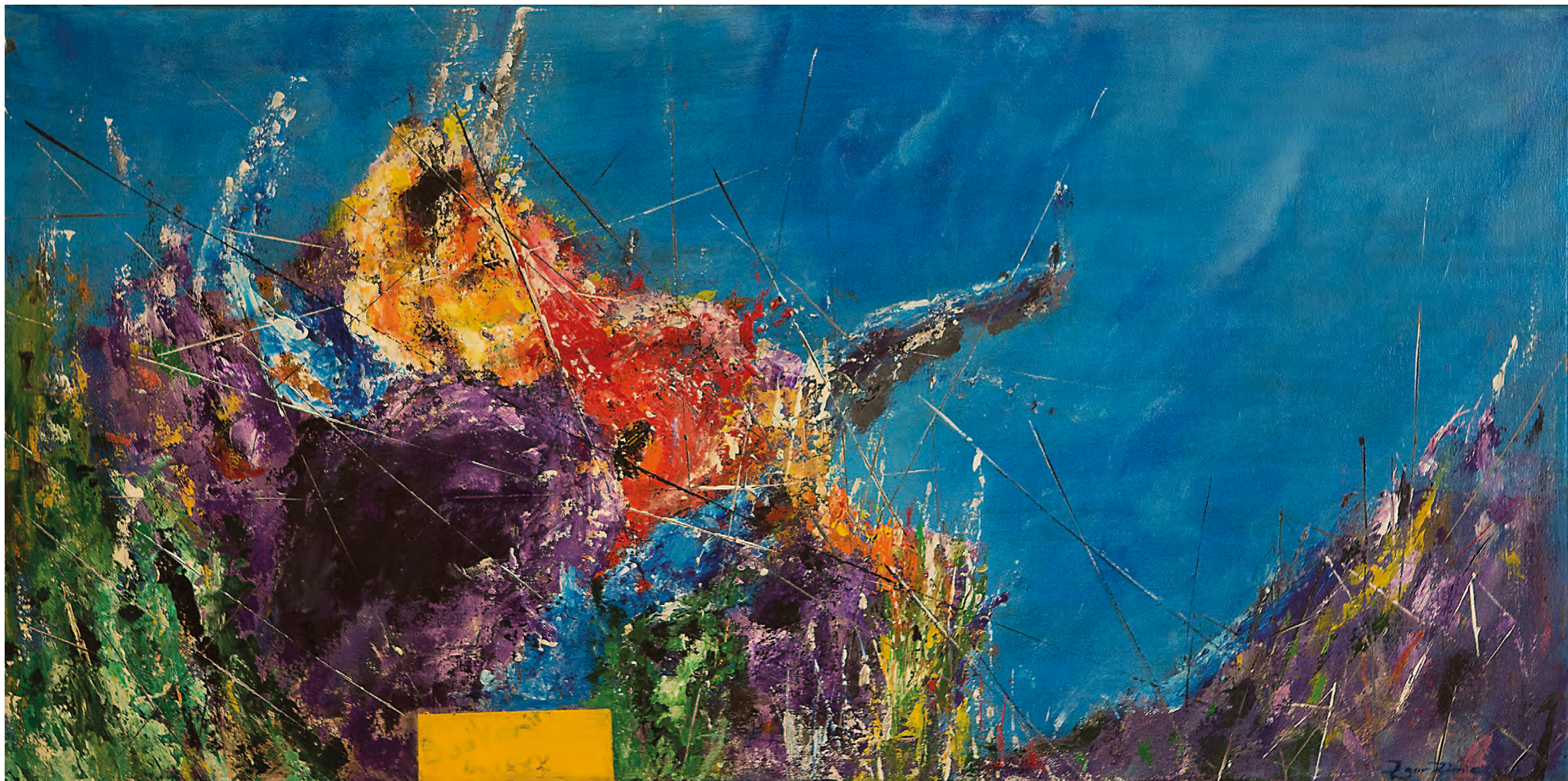
BOŠKARIN, 2017, akril-platno, 70 cm x 100 cm