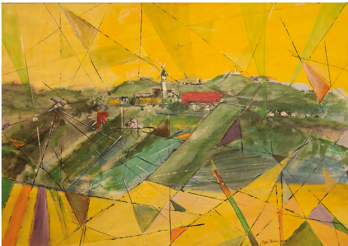
KRASNO, 2016 (serija briške vasice), akril - platno, 70 cm x 100 cm

čil v kompleksno, večplastno grajeno likovno predstavitev.