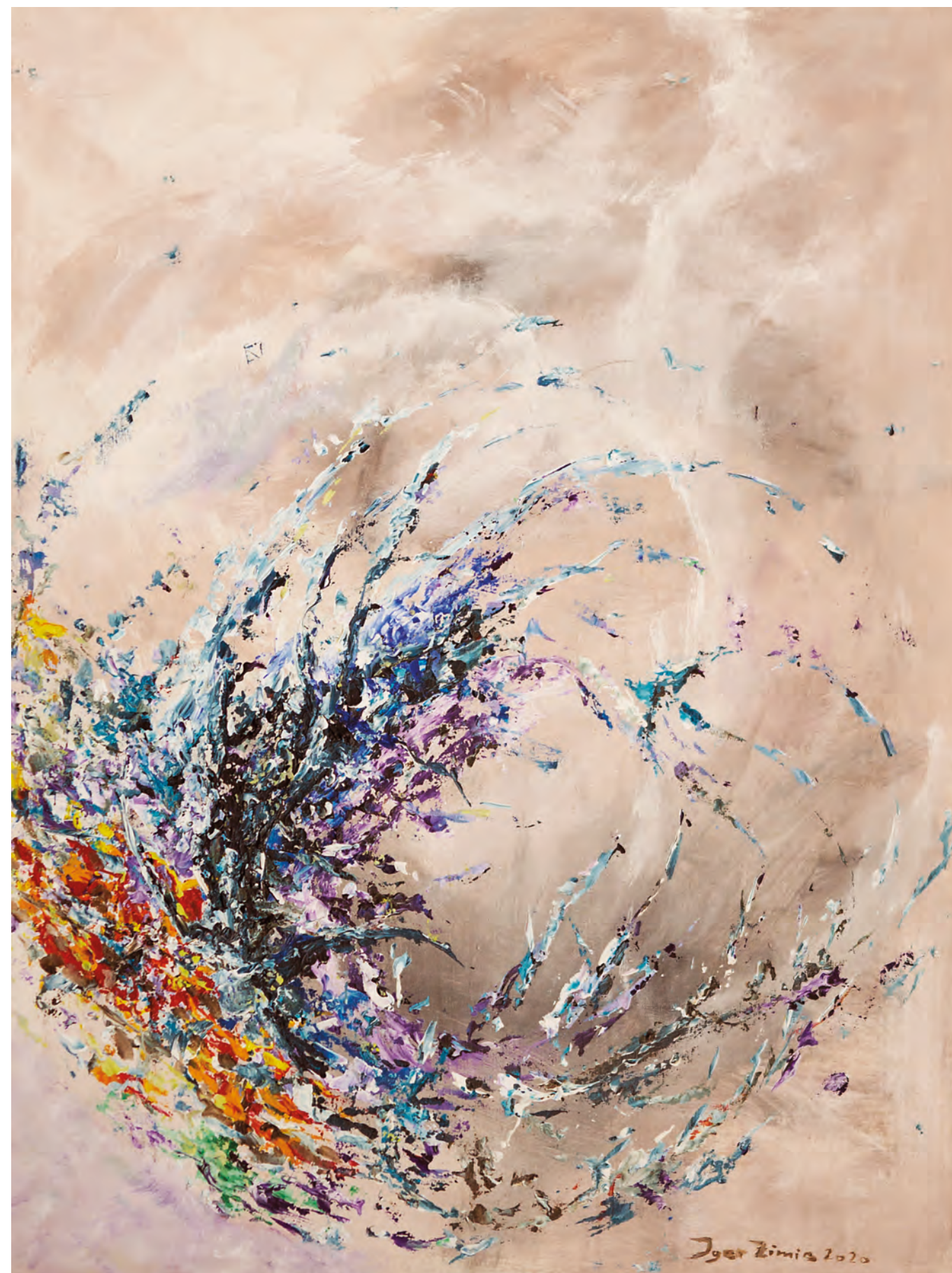
OBJEM, 2020, akril-platno, 78 cm x 56 cm