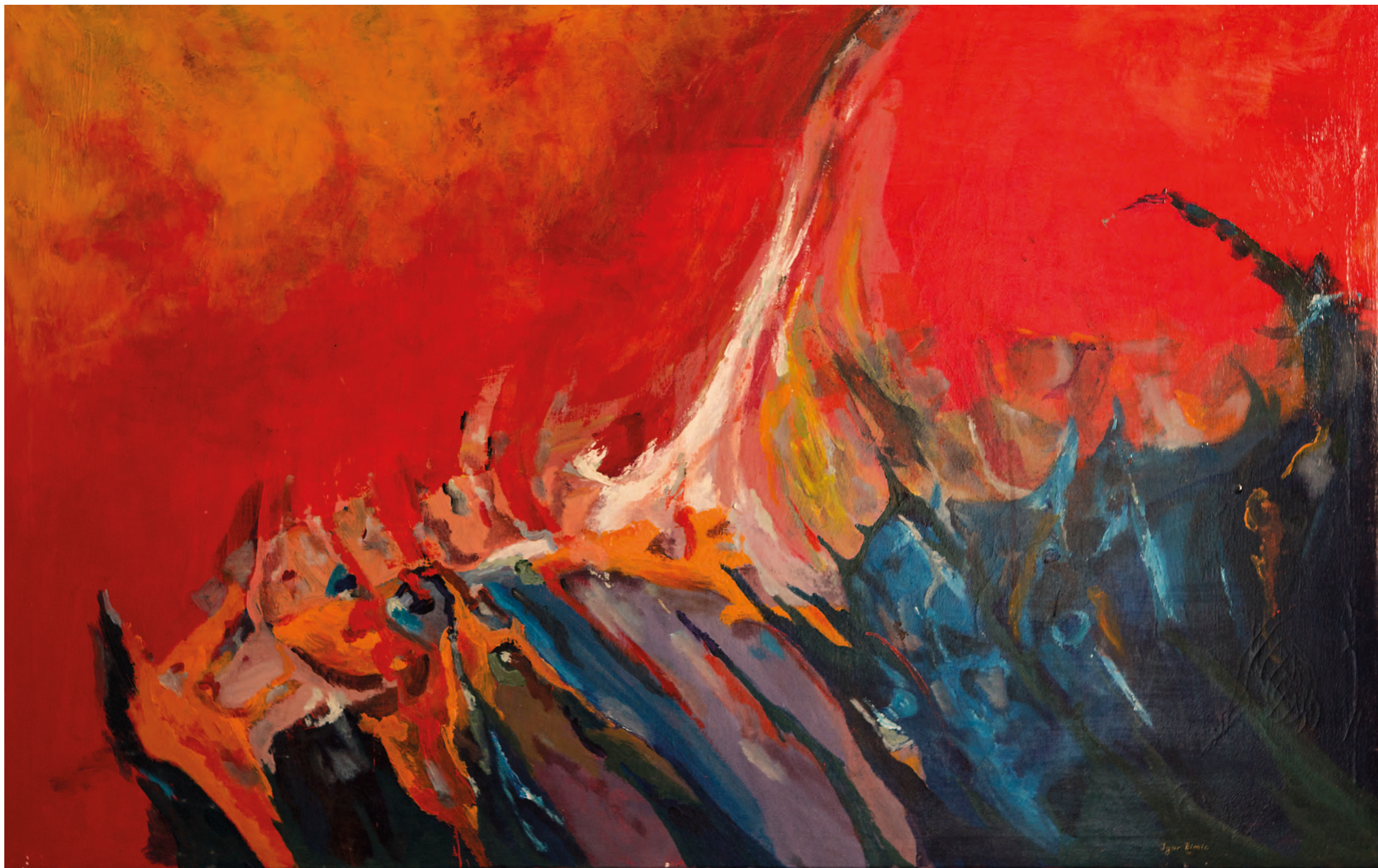
SPOMIN NA...., 2016, akril-platno, 90cm x 140 cm