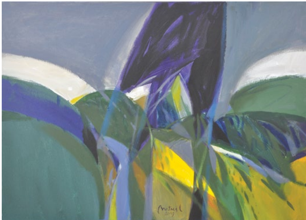
Telo pokrajine 05 , 2019, akril na platno, 50 x 70 cm Der Körper der Landschaft 05 , 2019, Acryl auf Leinwand, 50 x 70 cm

Professor für visuelle Kommunikation im Ruhestand bei der Akademie für Bildende Kunst und Design in Ljubljana in Ljubljana. Er arbeitet mit Malerei, Zeichnung, Grafik, Grafikdesign, Typografie, Kalligrafie und Fotografie. Der Großteil seines malerischen Oeuvres ist durch expressive Figuration repräsentiert. Einen prominenteren Platz in seinem malerischen Opus nimmt auch die Landschaft ein, die in einer erkennbar abstrahierten und expressiven Interpretation gegeben wird. Sein grafisches Oeuvre besteht hauptsächlich aus Lithographien, sowie Holzschnitten und Siebdrucken, in denen auch das Figürliche dominiert.