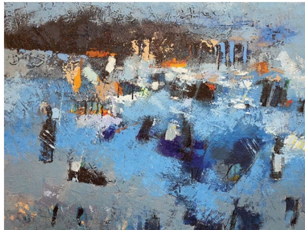
Pozabljeni spomini , 2022, mešana tehnika na platno, 66 x 85 cm Vergessene Erinnerungen , 2022, Mischtechnik auf Leinwand, 66 x 85 cm

Maler, Zeichner, Grafiker und Designer. Der im Irak geborene Künstler ist seit vier Jahrzehnten aktiver Mitgestalter zeitgenössischer Kunst in Slowenien. Er entwickelte eine erkennbare malerische Poetik, die eine Synthese all dessen ist, was er in sich trägt und gleichzeitig Spiegelbild äußerer Ereignisse ist. Seine Werke sind an ihrer speziellen „Karim“-Farbe zu erkennen, die uns in seine geheimnisvollen Raumillusionen entführt. Unter seinen anderen Ausstellungen stellte er 2019 auf Einladung des Europäischen Kulturzentrums im Rahmen der Biennale von Venedig im Palazzo Mora aus.